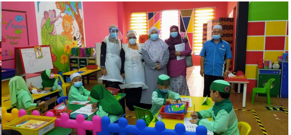
TASKI & TAHFIZ BANDAR ENSTEK