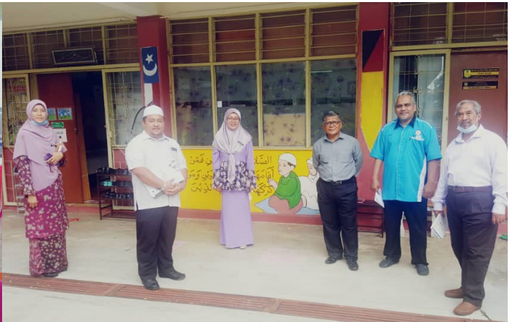
PRA BESTARI SEREMBAN