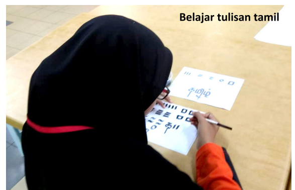
Belajar tulisan tamil

Program perasmian penutup disempurnakan oleh Exco Kerajaan Tempatan, Pengangkutan Awam dan Pembangunan Kampung Baru Selangor yang juga merupakan ADUN Kinrara, YB Ng Sze Han. Kem Muhibah yang dijalankan mendapat liputan luas akhbar The Star, portal Malaysiakini dan Free Malaysia Today. The Star mengemukan tajuk berita "Malaysia's lost unity" dan "Thumbs up for unity holiday camp", Malaysiakini dengan tajuk "Students get together in Muhibah Camp to overcome racial distrust", manakala Free Malaysia Today dengan tajuk "Jangan musnah keharmonian Malaysia, pelajar beritau pemimpin politik". Dalam masyarakat berbilang kaum di Malaysia, dikatakan bahawa inilah julung-julung kalinya kem seperti ini yang melibatkan sekolah agama dengan sekolah persendirian di bawah Dong Zong dilakukan. Secara umumnya, komen