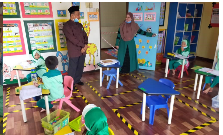
TASKI BESTARI MAWADDAH SAUJANA PUCHONG