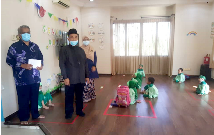
TASKI AL-HIKMAH SG. RAMAL