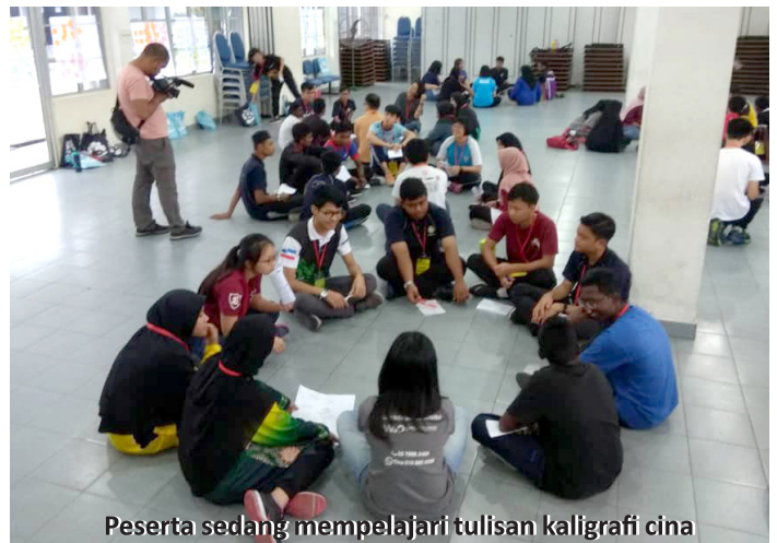
Peserta sedang mempelajari tulisan kaligrafi Cina dan perbincangan dalam kumpulan.

Memantapkan sesuatu organisasi boleh dibuat melalui jaringan. Jaringan ialah hubungan kerjasama sebagai sesuatu yang dijalin. Kerjasama pula didefinisikan sebagai usaha bersama-sama atau saling bantu-membantu antara dua atau beberapa pihak. Jalinan kerjasama juga turut membawa maksud kolaborasi, permuafakatan dan perkongsian. Kolaborasi dan kerja berpasukan adalah sangat penting dalam kesatuan matlamat. Sesebuah institusi pastinya tidak akan wujud secara bersendirian. Oleh itu permuafakatan bersama masyarakat dan organisasi luaran penting dalam membawa kejayaan. Banyak perkara yang boleh dibuat dalam aktiviti jaringan dan jalinan. Antaranya ialah lawatan sambil belajar, mengadakan aktiviti tertentu seperti sukan, seminar motivasi, kerjaya atau pendidikan. Di samping itu pertandingan inovasi, perbarisan, bahas atau berbalas pantun boleh dilaksanakan. Pertemuan dan perbincangan yang dibuat akan meningkatkan jaringan dan jalinan.