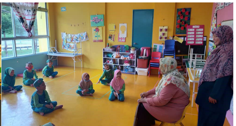
TASKI BONDA BESTARI SEMENYIH