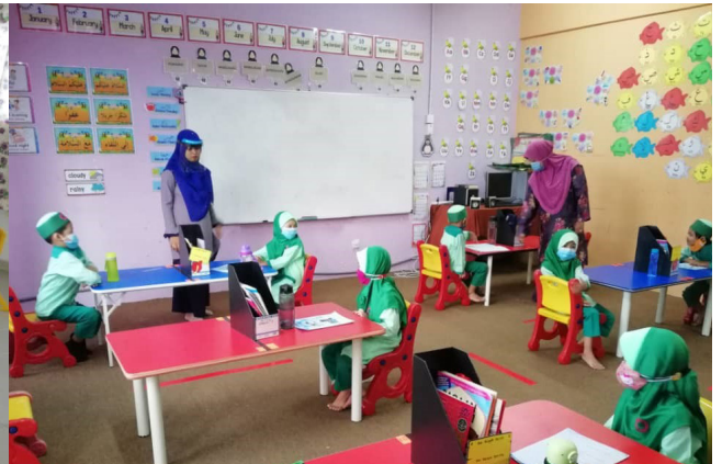
TASKI BESTARI KAJANG