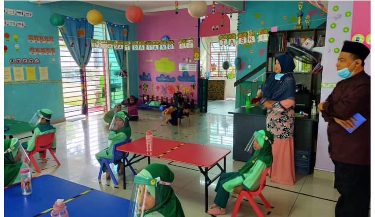
TASKI KHALIFAH BESTARI PUCHONG UTAMA